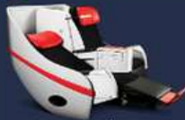
**อพเทค ณ วันที่ 26/02/67**